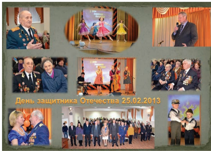
День защитника Отечества 25.02.2013