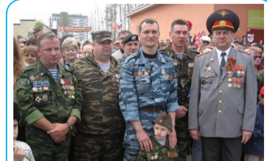
Воины-интернационалисты достойно продолжают дело отцов и дедов, об этом красноречиво свидетельствуют государственные награды на их груди