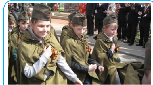
Маршируют правнуки Победителей