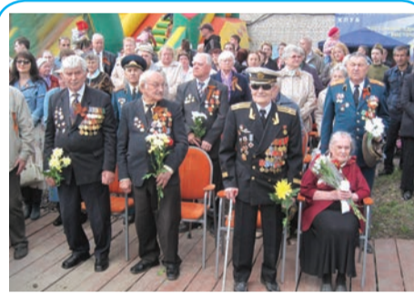
Под звуки Гимна МО «Новодевяткинское сельское поселение» встают все