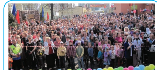
Большая новодевяткинская семья