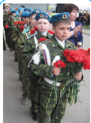
Через минуту правнуки вручат цветы тем, кто отстоял их право на жизнь

Всего, что в жизни самое лучшее, Мы желаем сегодня для Вас: Солнца ясного, благополучия, Теплых слов и приветливых глаз! Ну, а самое-самое главное: Пусть не старят Вам душу года, Желаем уюта, тепла и добра. Здоровья покрепче, чтоб век не болеть, Жить - не тужить и душой не стареть!